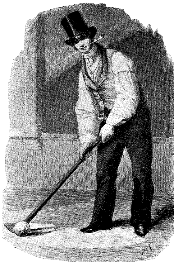
Een kolver c. 1830 met de lange Gouwnaar -ter bescherming tegen het breken — overdwers in den mond! Naar de gravure van den beroemden Henry Brown in „de Nederlanden”.