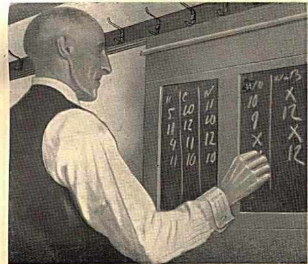
SCOREKAART — De scorekaart van den kolver is van een ander formaat als die van den golfer. Maar op beide staan cijfers. De golfer ziet er graag tweeën en drieën op, de kolver lieft elf en twaalf!

„Kulban”; dit beteekent stok met dikken knop (oude herdersstaf).