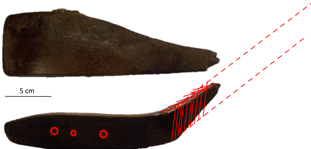
Figuur 1. Vnr. 576-1, boven- en zijaanzicht van een kolf gemaakt van waarschijnlijk esdoornhout (Acer spec.). Rode cirkels: lood in het hout; rode lijnen: de locatie waar de slof op de kolf heeft vastgezeten en hoe de kolf mogelijk vastgebonden heeft gezeten aan de stok van de kliek.

Het tweede object, vnr. 576-1, is een houten voorwerp gemaakt van waarschijnlijk esdoornhout (cf. Acer spec. ). Bij nader onderzoek blijkt het te gaan om een houten hoofd van een kliek (zie Figuur 1), een stick waar colf/kolf mee werd gespeeld, de voorganger van respectievelijk de golfclub en golf. Colf bestaat al sinds de 13 e eeuw, maar beleefde pas in de 17 e eeuw een bloeiperiode, waarna het kolf ging heten en op een (korte) kolfbaan werd gespeeld 1 . De kliek bestond uit een stok en een kolf (het houten hoofd) die doorgaans omwikkeld was met metaal om de kop tegen beschadigingen te beschermen 2 . De kolf die is aangetroffen te Leiden Groene Lakenplein komt qua vorm het meest overeen met de kliek die gebruikt werd voor colf, aangezien voor dit korte spel een zwaardere kliek noodzakelijk was 3 . Het object zelf vertoont echter geen sporen van gebruik of schade. De platte kant op de kliek wijst uit dat hij van een rechtshandige speler is geweest.