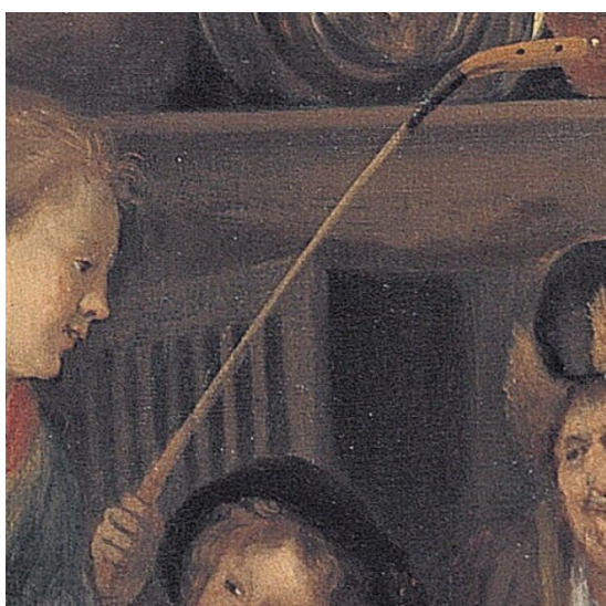
Figuur 3. Detail van het schilderij "Het Sint Nicolaasfeest" van Jan Steen uit ca. 1670. Hierop is de het lood in de kop van de Schotse kliek en het omwindsel duidelijk te zien.

Aangezien de gevonden kliek komt uit een context die dateert uit de tweede helft van de 17 e eeuw – eerste helft van de 18 e eeuw, zijn beide herkomsten mogelijk. Het verschil tussen lokale Leidse klieken en de Schotse klieken is dat Leidse kliekhoofden met lood waren omgoten, waarop soms de stempels van de stad en de kolfmakers werden gestempeld, terwijl Schotse klieken werden verzwaard met lood in het hout (Figuur 3).