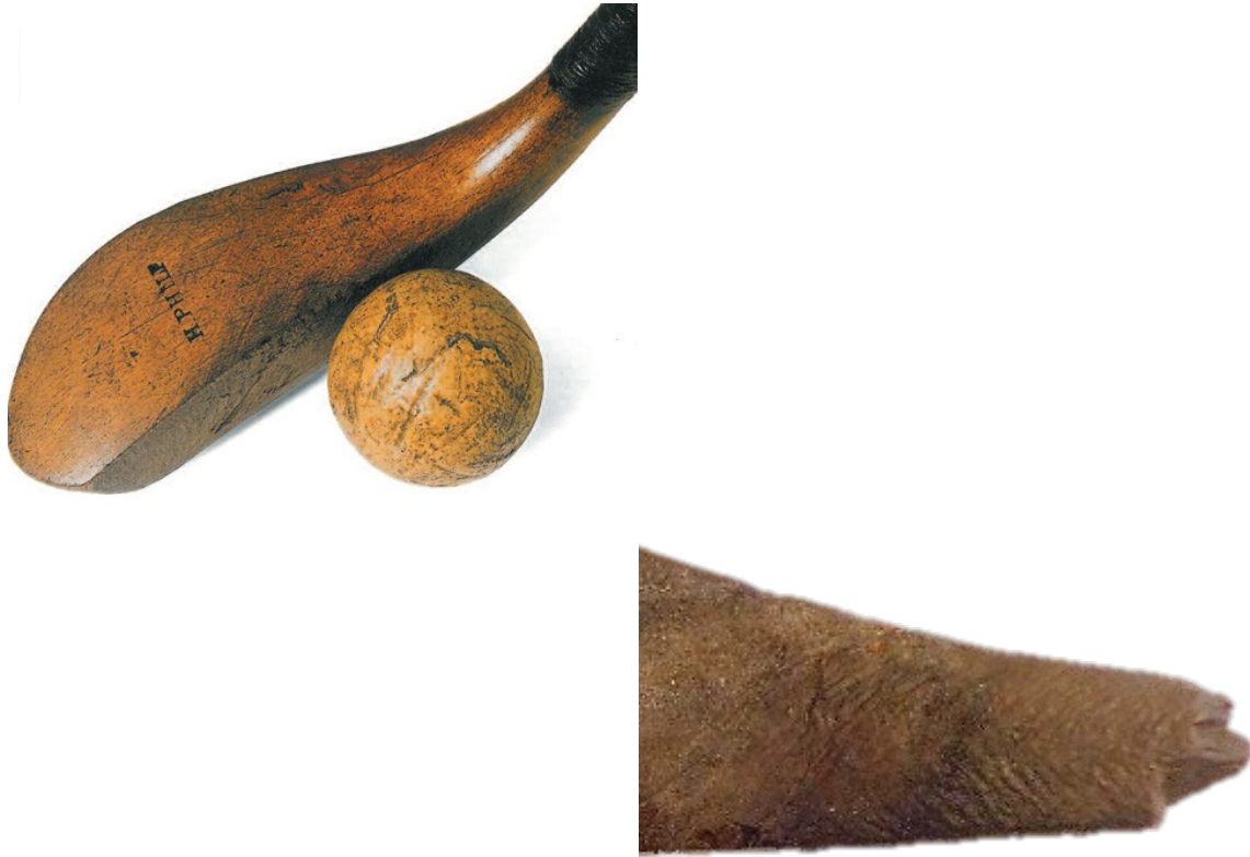
Figuur 4. Manier van omwinden van de slof van de kliek aan de stok. Links: een 18e eeuwse Schotse kliek met bal; rechts: detail van de gevonden kliek waar de indrukken van het omwindsel nog zichtbaar zijn.

De slof en de stok, vaak van verschillende houtsoorten gemaakt, werden aan elkaar verbonden door omwindsel (Figuur 3). Hiervan zijn ook nog sporen aanwezig op de gevonden kliek.